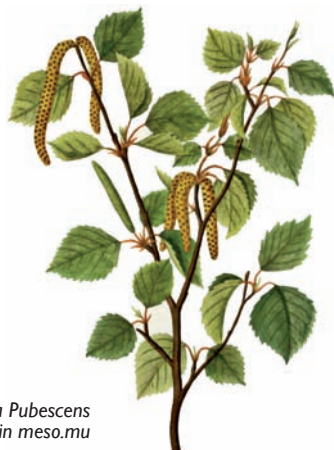
Betula pubescens contenuta in meso.mu