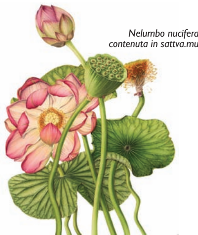
Nelumbo nucifera contenuta in sattva.mu

Abbiamo, così, soppresso una delle funzioni più importanti dell’alimentazione: il cibo come “prima medicina” (Ippocrate). Da queste considerazioni nasce l’esigenza di compensare le misconosciute e molte frequenti, anche gravi, carenze nutrizionali, con integratori fitoterapici costituzionali nello specifico endo.mu, meso.mu ed ecto mu, associati ai fitoterapici strutturali bioenergetici il sattva.mu ed il benevit.mu, capaci di apportare la “giusta” energia in termini di oligoelementi, ad un “debole” sistema PNEI. Si tratta di una terapia simbiotica, analogica con i movimenti energetici,