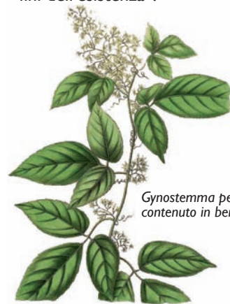
Gynostemma pentaphyllum contenuto in benevit.mu

In conclusione e per ricapitolare possiamo affermare che comprendere le malattie significa coglierne la quintessenza codificata in miliardi di anni nei codici biologici epigenetici. I costanti tentativi che il vivente compie per adeguarsi all’ambiente per la sopravvivenza e per la riprogrammazione/evoluzione. I rimedi fitoterapici costituzionali endo.mu, meso.mu ed ecto.mu e quelli bioenergetici, benevit.mu e sattva.mu, facilitano la sintonia coerente informazionale, armonica e simbiotica con l’Organismo/Ambiente in maniera che tutte le cose e gli esseri viventi evolvano in armonia solidale, sinergia e biorisonanza, verso il comune Tao, per gli “alti fini dell’esistenza”.